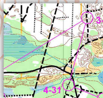
Specjalistyczna mapa do RJnO