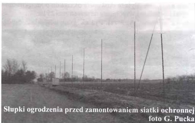
Słupki ogrodzenia przed zamontowaniem siatki ochronnej