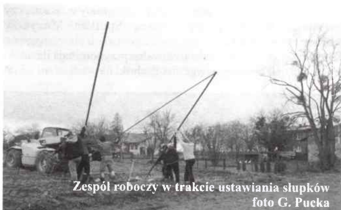
Zespół roboczy w trakcie ustawiania słupków

Niemal dokładnie 5 lat temu (13 grudnia 2010 r.) reaktywowano Ludowy Zespół Sportowy w Żytniowie. Wiosną następnego roku wykonano niezbędne prace porządkowe wokół boiska do gry w piłkę nożną a budynek starej zlewni mleka przystosowano na szatnie dla zawodników i sędziów; przygotowano również do gry płytę boiska. Już wtedy wiadomo było jednak, że w niedalekiej przyszłości niezbędne będą dalsze prace związane z przebudową płyty boiska, zapewniającego bezpieczny przebieg zawodów.