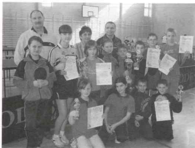
Zdobywcy pucharów w kat. klas IV-VI