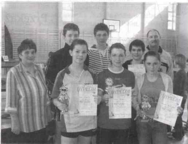
Zwycięzcy w kategorii gimnazjum