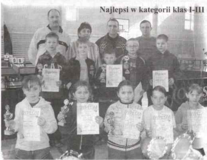
Najlepsi w kategorii klas I-III