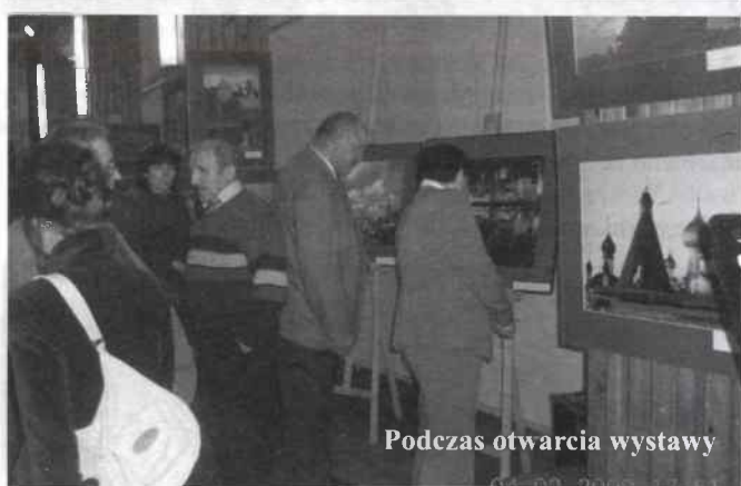
Podczas otwarcia wystawy

i co najważniejsze- stała troska państwa i lokalnych społeczności o wartość światowego formatu.