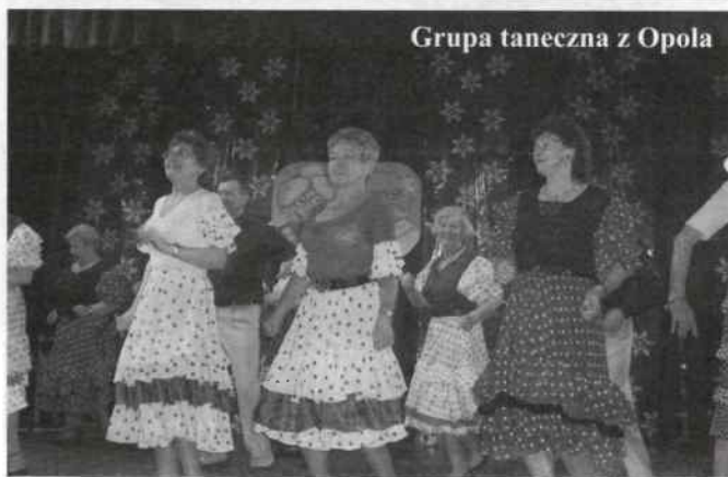
Grupa taneczna z Opolu

chór, grupa taneczna, kabaret. Wszyscy świetnie się bawili i bardzo miło spędzili niedzielne popołudnie. Sala wypełniona była po brzegi. Spotkanie zakończyło się słodkim poczęstunkiem i zabawą taneczną. Imprezę przygotował Dom Kultury w Rudnikach przy współpracy Przedszkola Publicznego w Rudnikach.