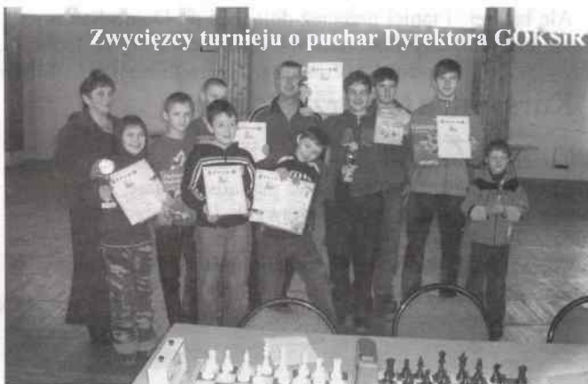
Zwycięzcy turnieju o puchar Dyrektora GOKSiR