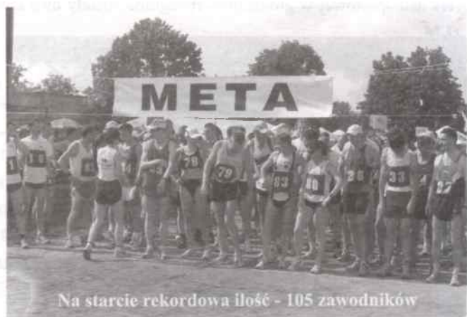
Na starcie rekordowa ilość - 105 zawodników