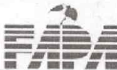
Fundacja Programów Pomocy dla Rolnictwa