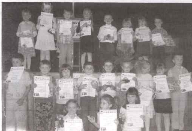
Uczestnicy z przedszkola