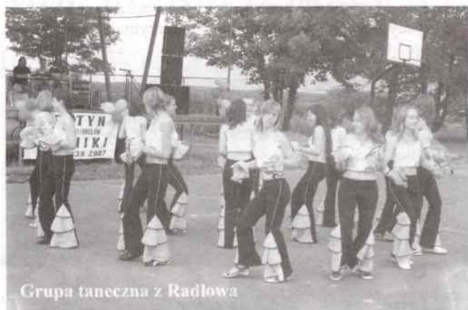
Grupa taneczna z Radłowa