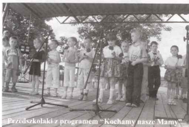
Przedszkolaki z programem "Kochamy nasze Mamy"

W upalne sobotnie popołudnie, 26 maja, na boisku sportowym w Rudnikach miał miejsce majowy festyn integracyjny. Na hali sportowej w gimnazjum rozegrane zostały dwa mecze piłki siatkowej reprezentacji gimnazjum w Rudnikach oraz