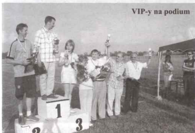
VIP-y na podium

W biegach dzieci i młodzieży, najlepsi z terenu naszej gminy okazali się: