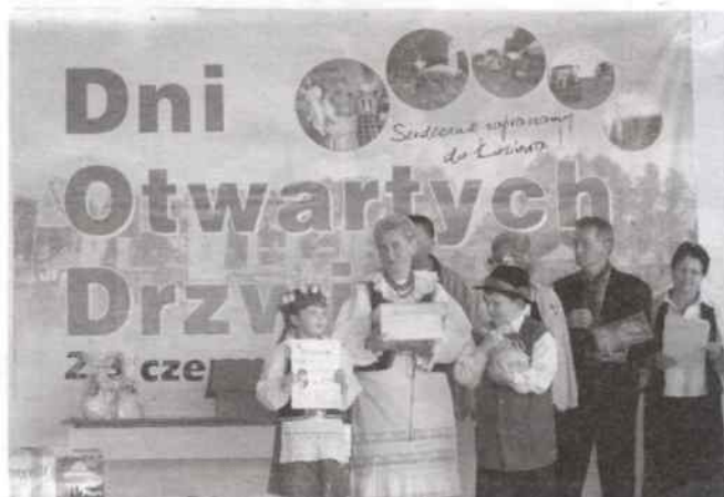
Radość z nagrody

Konkurs miał zasięg międzywojewódzki. Uczestniczyło w nim ponad 400 osób, głównie z terenu województwa śląskiego. Nagrodzone prace wystawione zostały w Galerii „PRYZMAT” w Ośrodku Kultury we Wręczycy Wielkiej. M.L.