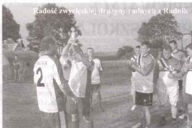
Radość zwycięskiej drużyny radnych z Rudnik