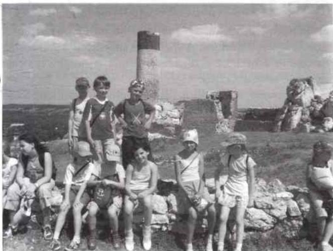
W Olsztynie było upalnie

Dzieci obcowały z przyrodą, poznawały uroki Załęczańskiego Parku Krajobrazowego. Zobaczyły jaskinie w rezerwatach „Szachownica” i „Węże” oraz „Źródleko