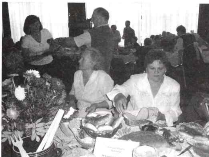
Nagrodzone żytniowskie bułeczki i rudnicki chleb