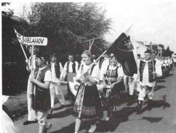
Goście z Soblahova

Uroczysta dziękczynna msza święta odprawiona została w kościele parafialnym w Ciecuiowie, po czym korowód