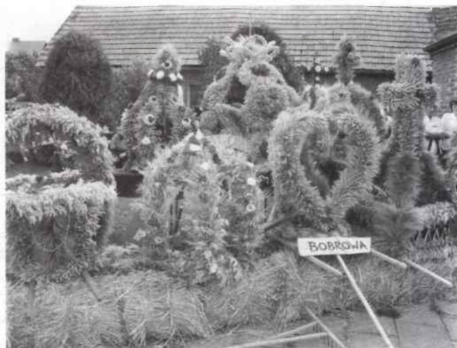
Wieńce dożynkowe - było ich aż 11

Gminę Rudniki w wojewódzkim konkursie wieńcowym