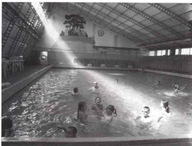
Basen - ucieczka przed upałami

Objawienia” w lesie dzietrznickim. Zabawa w podchody, którą zapoczątkowaliśmy w lesie zakończyła się prawdziwymi podchodami w poszukiwaniu autokaru. Przygoda niezapomniana. Nie mniej atrakcyjne były wyjazdy do Olsztyna, Złotego Potoku czy ogrodu zoologicznego w Opolu. Szczególną pozycję programu półkolonii stanowiła całodniowa wycieczka do Jednostki Wojskowej w Brzegu i moc atrakcji na wojskowych poligonach.