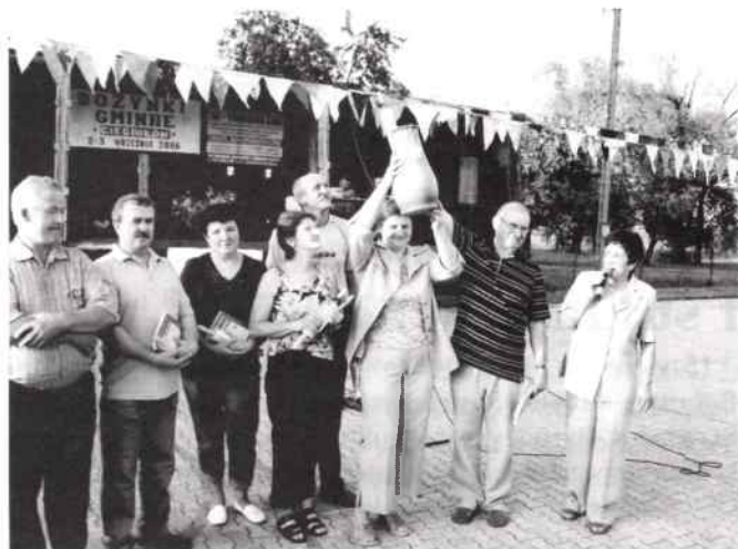
Radość po wręczeniu nagród

Organizatorem imprezy był GOKSiR w Rudnikach.