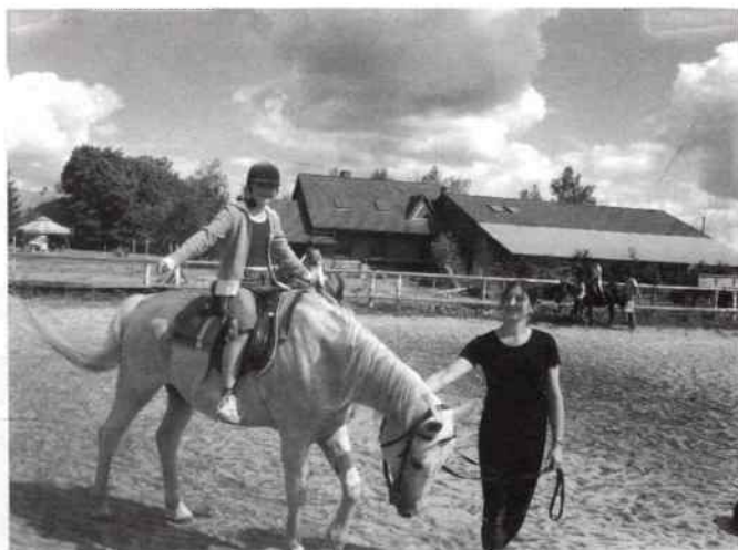
Przejażdżki konne – rewelacja!

Wielką atrakcją okazały się warsztaty garnacarskie zorganizowane w cegielni w Faustiancie, podczas których powstały piękne wyroby z gliny.