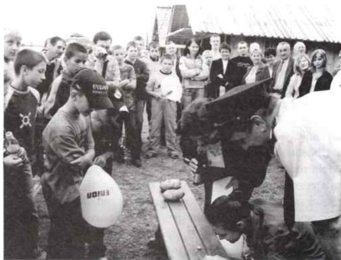
Konkurs na najmniejszego i największego ziemniaka

Organizatorem przedsięwzięcia była OSP w Bobrowej przy współpracy Gminnego Ośrodka Kultury, Sportu i Rekreacji w Rudnikach.