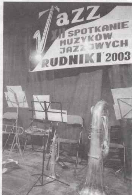
fol. "Kulisy Powiatu"