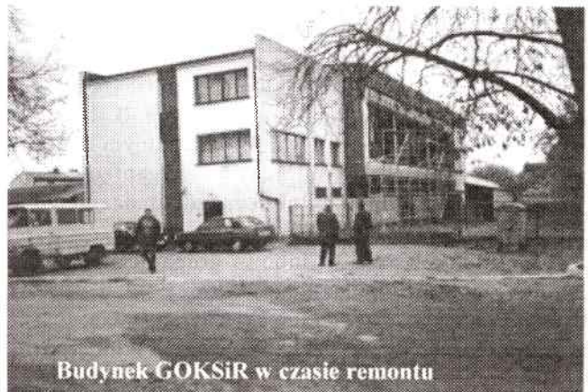
Budynek GOKSiR w czasie remontu

Na przyszły rok planujemy kolejny etap prac remontowych. Dzięki wykonanym pracom znacznie wrośnie standard sali, będzie cieplej a koszty ogrzewania znacznie się zmniejszą.