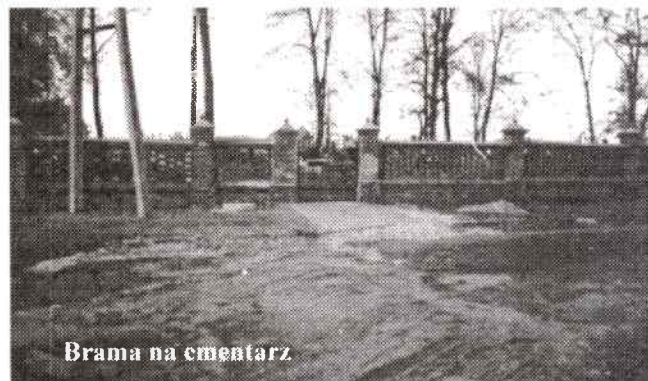
Brama na cmentarz

Gratulujemy udanych dotychczasowych wydań i życzymy kolejnych ciekawych tematów oraz pomysłów. Cieszymy się, że dzieci piszą o sobie i swoich problemach.