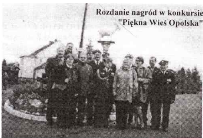
Rozdanie nagród w konkursie "Piękna Wieś Opolska"

Na rozdanie nagród do Żyrowej pojechała delegacja z naszej gminy (na zdjęciu). Strażacy odebrali czek w wysoko-