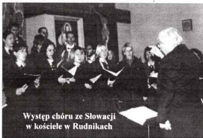
Występ chóru ze Słowacji w kościele w Rudnikach

12.11 - występ chóru "MLADOST" z Banskiej Bystrzycy ze Słowacji w kościele parafialnym w Rudnikach. Koncert z okazji Święta Niepodległości.