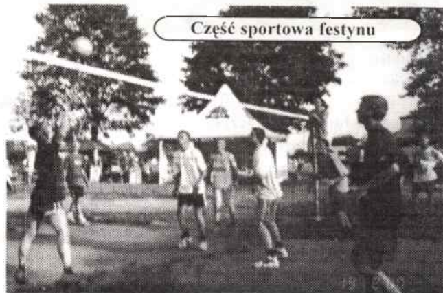
Część sportowa festynu

Festyn rozpoczął się na sportowo. W sobotę odbyły się mecze piłki nożnej, siatkówki. Dla dzieci przygotowano gry, zabawy i konkursy zrecznościowe. W niedzielę na wielkiej scenie bawił zebranych kabaret „Rzysko”, zespół „Rudniczanki”, zaprezentowały dorobek kulturalny dzieci z Lwowa, przebywające gościnnie u rodzin w gminie Rudniki.