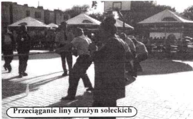
Przeciąganie liny drużyn soleckich

Biesiadę zakończyła zabawa taneczna, która trwała do białego świtu.