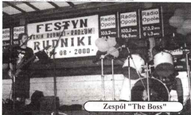
Zespół "The Boss"

Wydawca: "WIPRESS" Sp. z o.o. 98-300 Wieluń, ul. Palestrancka 5, tel. (0 43) 843 83 48