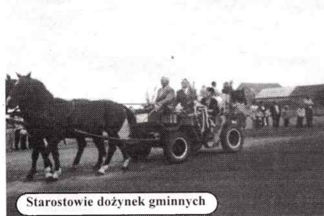
Starostowie dożynek gminnych