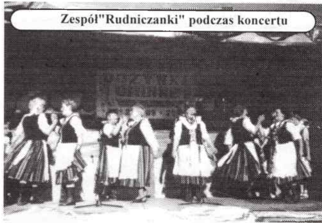
Zespół "Rudniczanki" podczas koncertu

Następnego dnia, w niedzielę, odbyły się główne uroczystości. Barwny korowód dożynkowy wyszedł z miejscowości Bugaj Nowy, poprzez Bugaj Stary przemarszerował na boisko sportowe w Ciecuiłowie. Szły poczty sztandarowe wszystkich gminnych jednostek OSP, orkiestra dęta z Żytniowa, kobiety w strojach ludowych niosły wieńce dożynkowe,