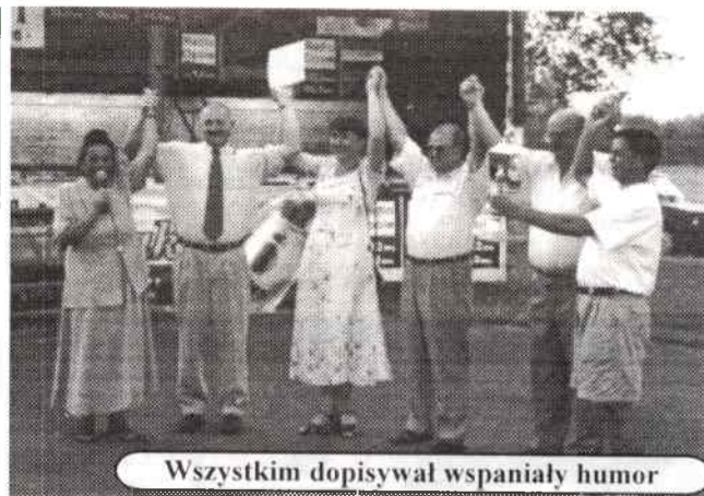
Wszystkim dopisywał wspaniały humor

Festyn rozpoczął się na sportowo. W sobotę odbyły się mecze piłki nożnej, siatkówki. Dla dzieci przygotowano gry, zabawy i konkursy zrecznościowe. W niedzielę na wielkiej scenie bawił zebranych kabaret „Rzysko”, zespół „Rudniczanki”, zaprezentowały dorobek kulturalny dzieci z Lwowa, przebywające gościnnie u rodzin w gminie Rudniki.