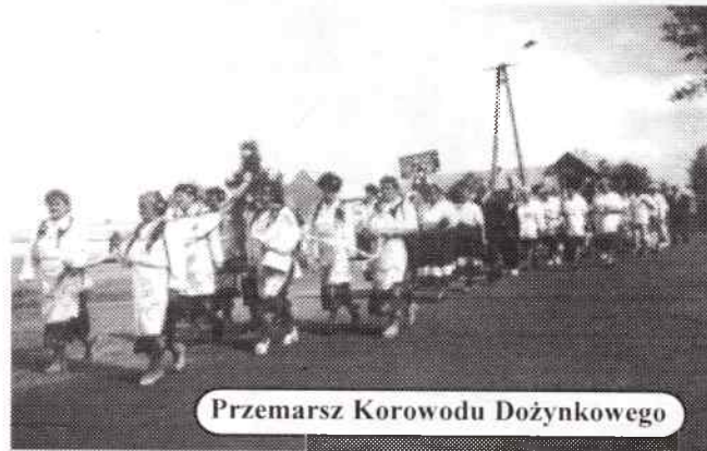
Przemarsz Korowodu Dożynkowego

Dożynki Gminne w tym roku zorganizowali mieszkańcy wsi Bugaj i Ciecuiłów przy współpracy Gminnego Ośrodka Kultury, Sportu i Rekreacji w Rudnikach. Impreza miała charakter dwudniowego festynu. Już w sobotę 26 sierpnia trwały zawody sportowo-rekreacyjne oraz konkurencje sprawnościowe dla dzieci, zakończone zabawą taneczną.