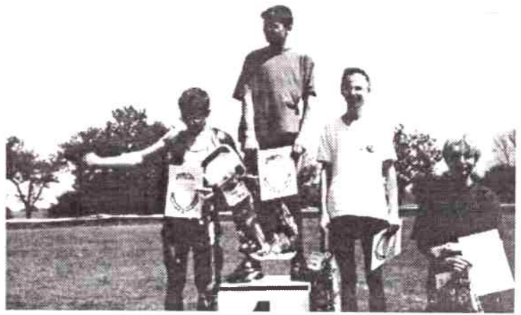
Zwycięzcy kat. klas VII - VIII