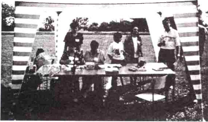
Biuro Organizacyjne biegów