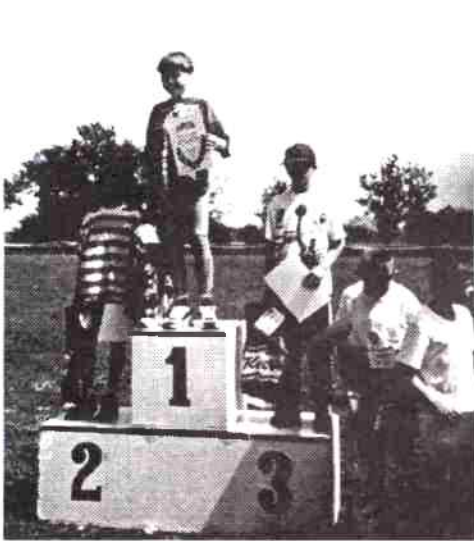
Zwycięzcy kat. klas III - IV