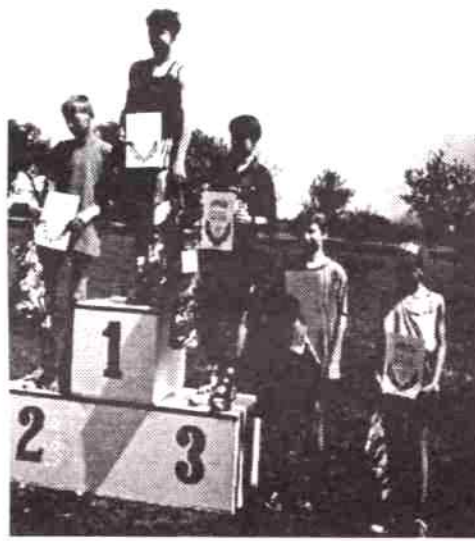
Zwycięzcy kat. klas V - VI