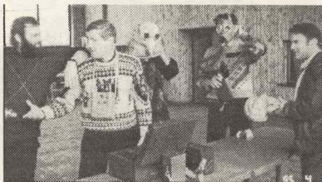
Na szkoleniu formacji obrony cywilnej, które odbyło się w GOK w Rudnikach

Mimo ustawowego obowiązku uczestniczenia członków O.C. w szkoleniach i ćwiczeniach wynikającego z ustawy o poszerzonym obowiązku obrony Rzeczypospolitej Polskiej, należy podkreślić wielką aktywność i wysoką dyscyplinę uczestników szkoleń.