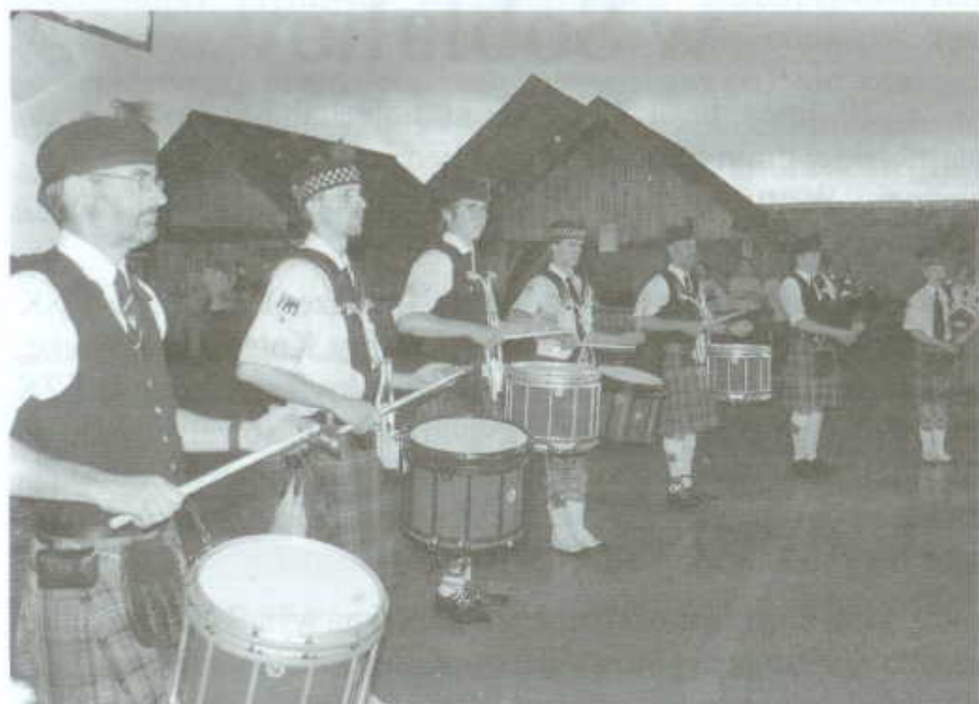
Faceci w spódnicach