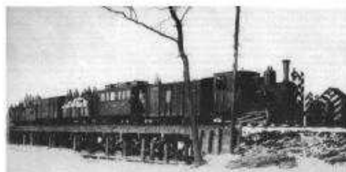
Na zdjęciu: "Pociąg wojskowy na moście granicznym w Praszce na linii do Działoszyna /przez Rudniki/".