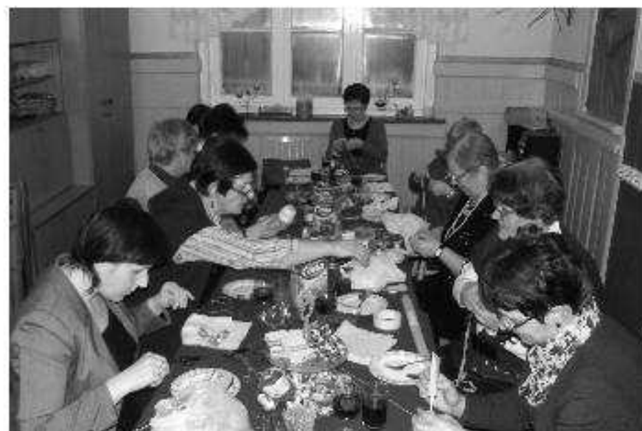
Dzień Kobiet w Młynach to nie tylko ploty. Panie ostro wzięły się do roboty!

Panie świętowały przy domowych smakołykach i lampce wina. W miłym towarzystwie czas mijał szybko, tym bardziej, że Nasze Panie lubią aktywnie spędzać czas. Za pasem Wielkanoc, więc przy okazji „Dnia Kobiet” zorganizowaliśmy