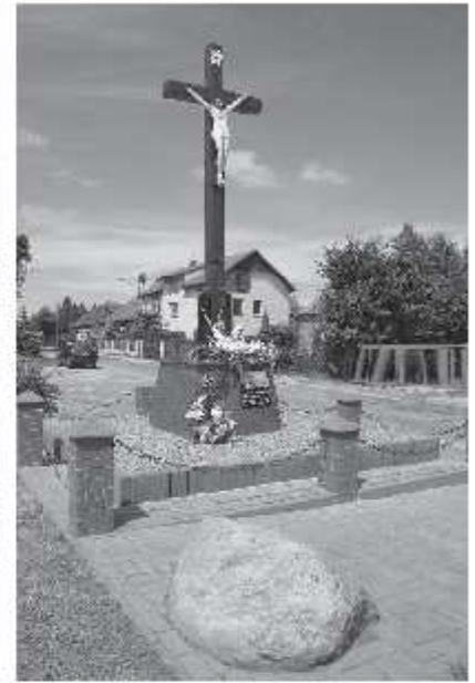
Postument krzyża misyjnego w Żytniowie przed i po przebudowie.